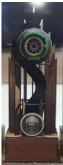
FIGURA 2 – Modelo do troféu distribuído aos pilotos campeões pela Liga Prorace