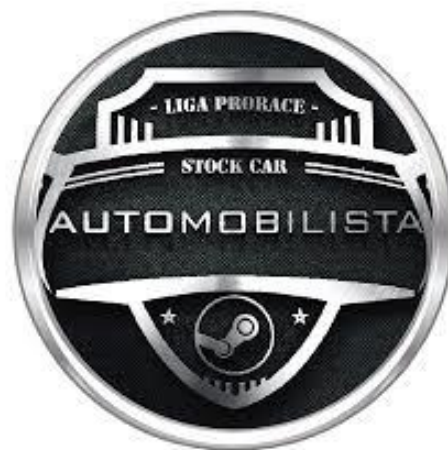
FIGURA 1 – Brasão AUTOMOBILISTA STOCK CAR