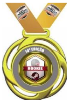
FIGURA 3 – Modelo das medalhas personalizadas distribuídas pela Liga Prorace