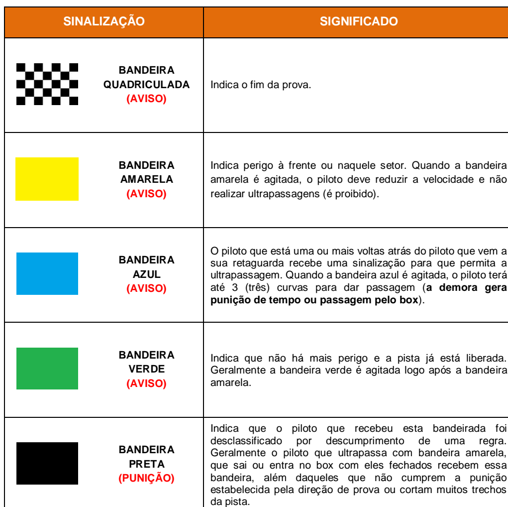
TABELA 7 – REGRA DAS BANDEIRAS / SINALIZAÇÃO NO JOGO

10.16 A seguinte sinalização será usada na TEMPORADA: